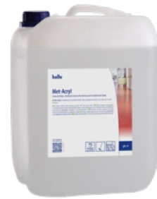
Art.Nr. g0600 Kanister 10 L